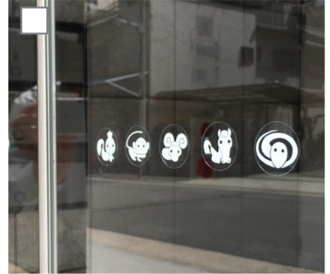
干支 12支 ガラス衝突防止シール