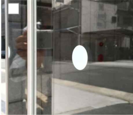
シンプル ホワイト ガラス衝突防止シール